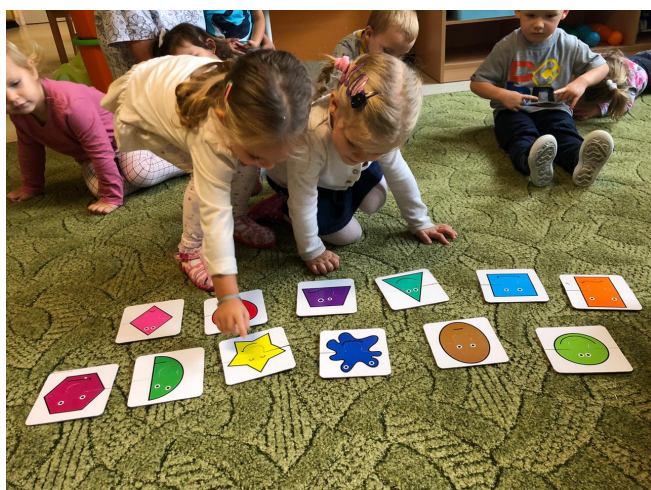
Dzień Uśmiechu w grupie Tygryski