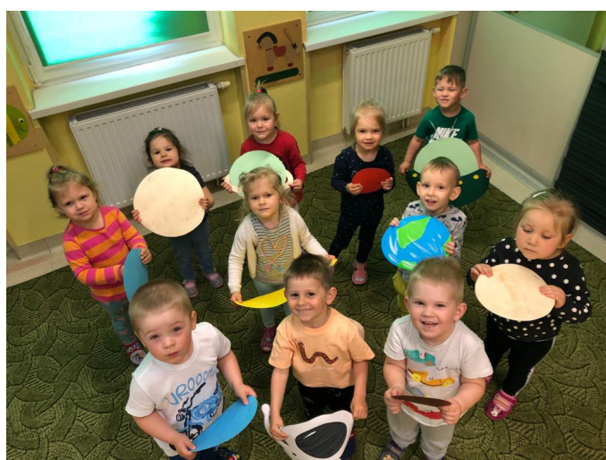
Tygrysy poznają Układ Słoneczny