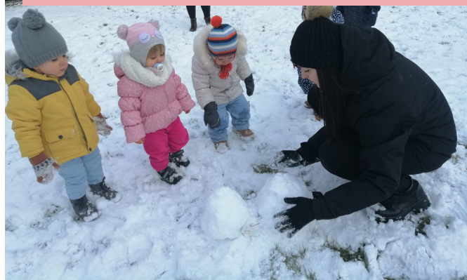
Lepimy dziś bałwana Skrzaty