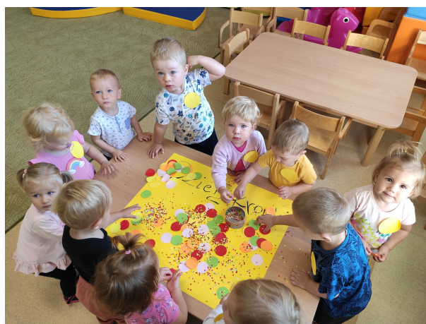
Dzień Kropki w grupie Żabki