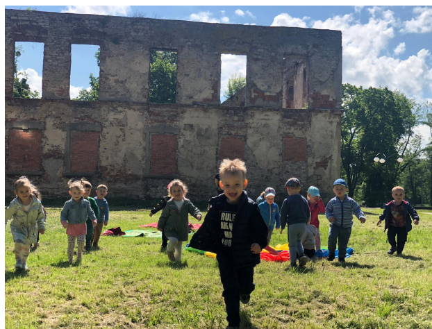
Żłobkowe odkrywanie parku