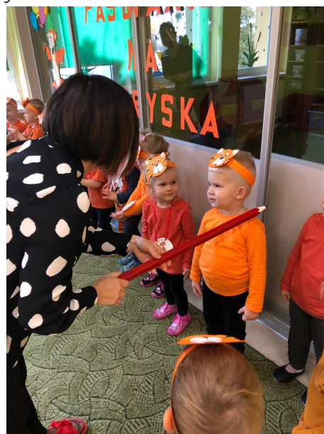
Zostaję żłobiakiem - pasowanie