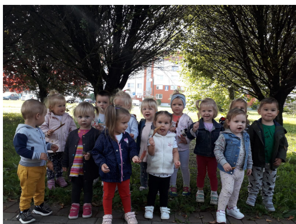
Misie na pierwszym jesiennym spacerze

Miejsce, gdzie uczymy i dbamy o tradycję. Nie boimy się również sytuacji i wydarzeń niecodziennych. Ze wszystkim, z pomocą naszych Pań, dajemy sobie radę. Zobaczcie sami: