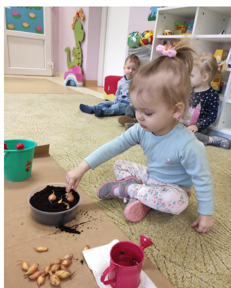
Żabki sadzą kwiatki