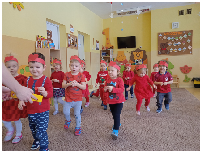
Walentynkowy wyścig Misiów