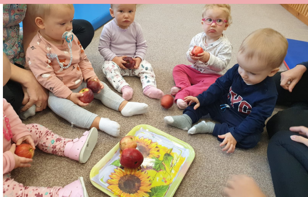
Dzień Jabłka w grupie Słoneczka