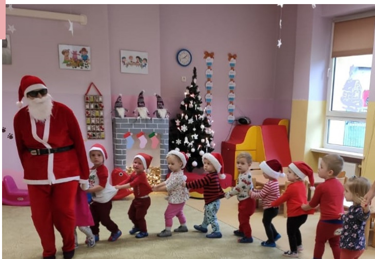
Mikołaj u Żabek