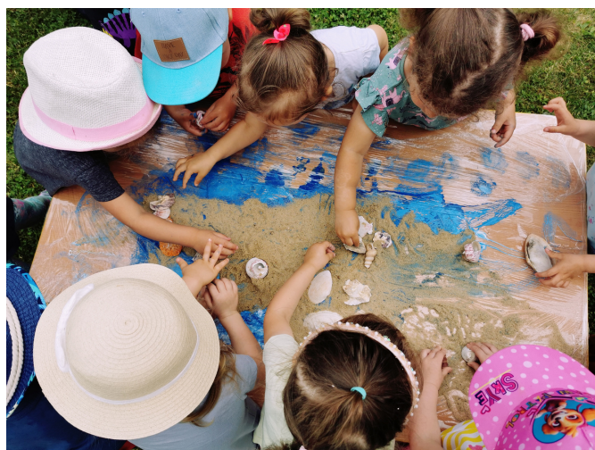
Dzień Ziemi w grupie Liski