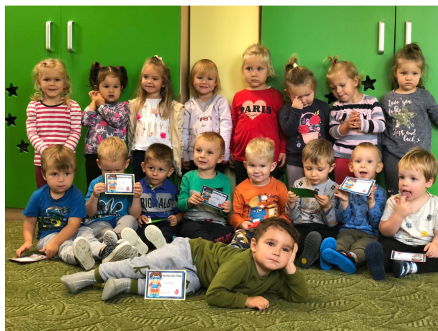
Dzień Chłopaka w grupie Tygryski