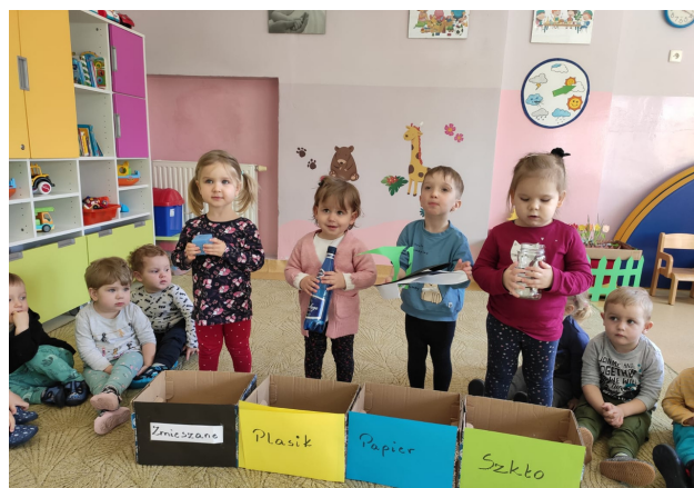
Żabki uczą się segregacji śmieci