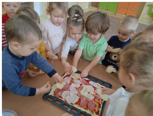
Dzień pizzy u Misiów