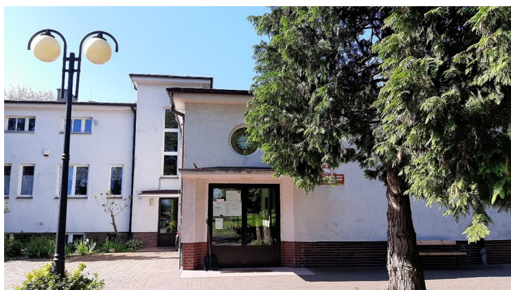
Budynek Zespołu Placówek Oświatowych w Kalinowicach

sekretariat@zpokalinowice.strzelceopolskie.edu.pl