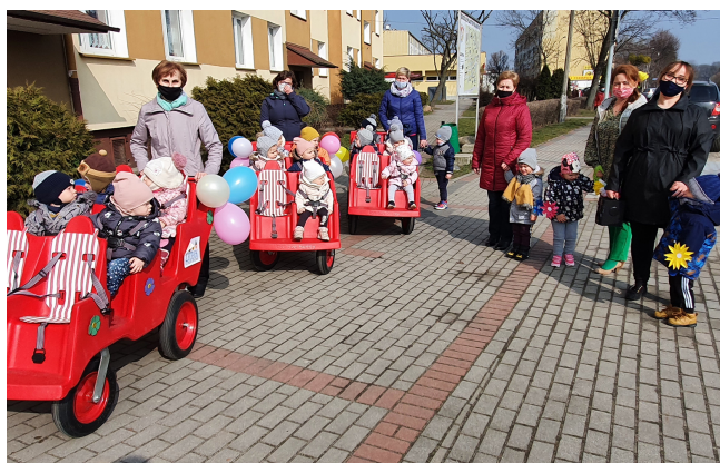
Wiosenny spacer Słoneczek i Tygrysków