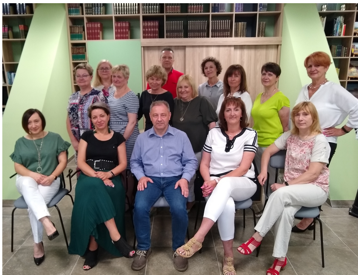
Kadra zarządzająca jednostkami oświatowymi Gminy Strzelce Opolskie