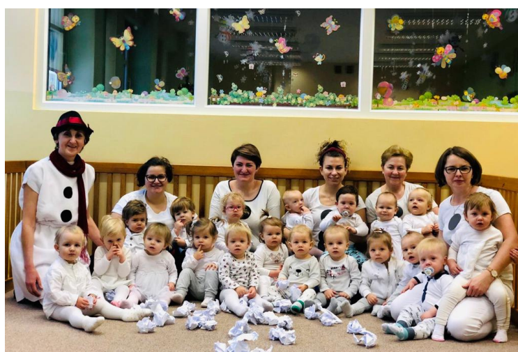
Dzień bałwanka w grupie Słoneczka