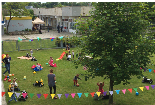
Plac zabaw żłobka

Nasz Żłobek to miejsce, gdzie tworzymy warunki do wspierania wielostronnego rozwoju dzieci, budujemy środowisko ciepłe pod względem emocjonalnym, miejsce wielu aktywności dziecięcych.